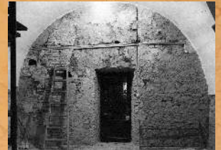
Remont szatni. 1996 r.