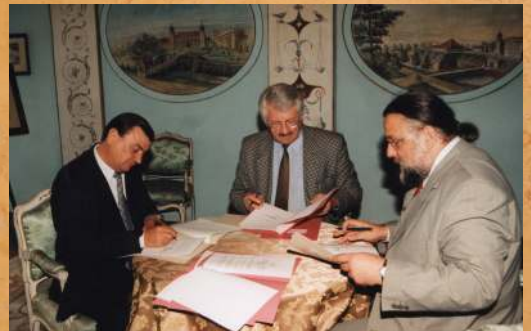
Podpisanie porozumienia o współpracy, pomiędzy Parkiem Dendrologicznym Zosiówka, Ośrodkiem Ochrony Zabytkowej Krajobrazu i Muzeum-Zamkiem w Łańcutcie. 1999 r.