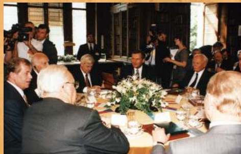
Spotkanie Prezydentów 9 państw Europy Środkowej. 1996 r.