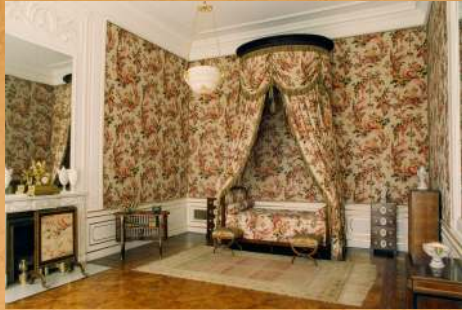
Zakończenie prac konserwatorskich w Sypialni Księżnej Marszałkowej. 1995 r.