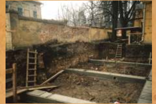
Budowa nowych toalet. 1996 r.