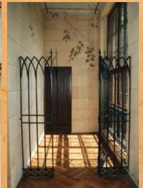
Konserwacja wnętrza Zameczku Romantycznego. 1998 r.