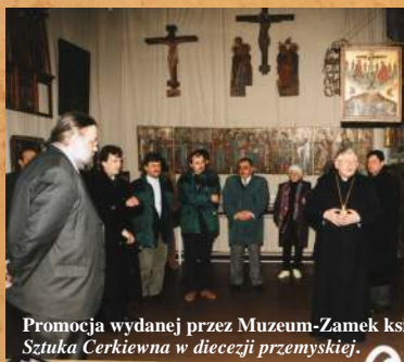
Promocja wydanej przez Muzeum-Zamek książki, Sztuka Cerkiewna w diecezji przemyskiej .