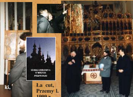
Łańcut, Przemyski l. 1999 r.