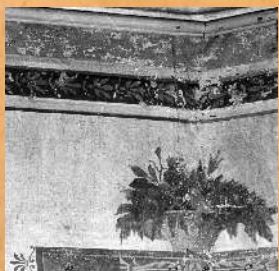
Konserwacja Salonu Pompejańskiego na II piętrze. 1991 r.