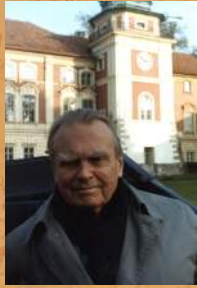
Wizyta Czesława Miłosza. 1992 r.