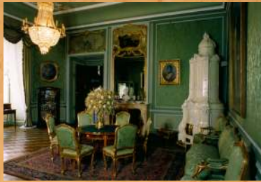
W 1992 r. zakończono prace w Salonie Zielonym