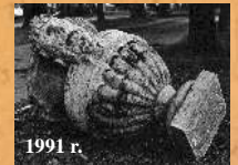
1991 r. Kłopoty z wandalami ...