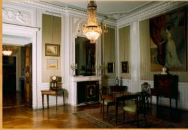
W 1991 zakończono prace konserwatorskie w Salonie i Łazience Apartamentu Paradnego.