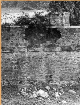
Uszkodzenie Bastionu zach. 1991 r.