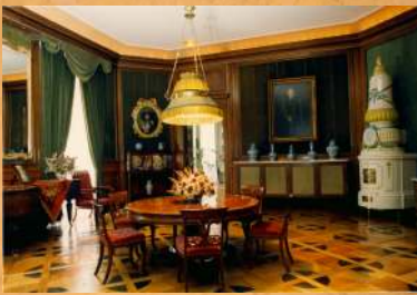
... i Salonie Wejciowym.