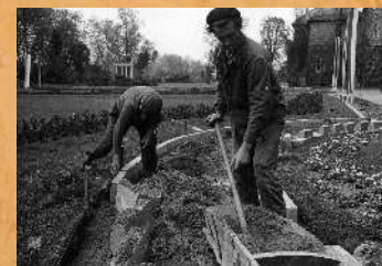
Zakładanie krawężników i utwardzanie alejek. 1967 r.