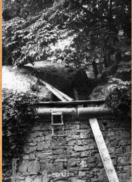
Badania archeologiczne. 1965 r.