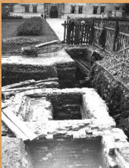
Prace archeologiczne przy moście zachodnim. 1967 r.