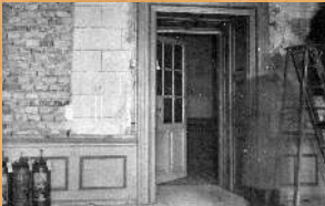
Prace remontowe w Zameczku Romantycznym. 1965 r.