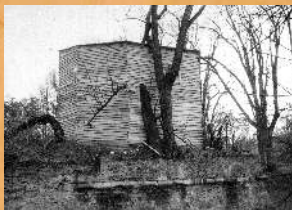
Konserwacja Glorietty. 1965 r.