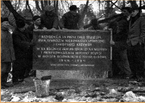
Uroczyste odsłonięcie obelisku nastąpiło w 1964 r. ... a mniej uroczysty demontaż w 1989 r.