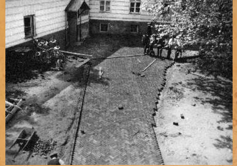
Reparacja nawierzchni dziedzińca ca. 1965 r.