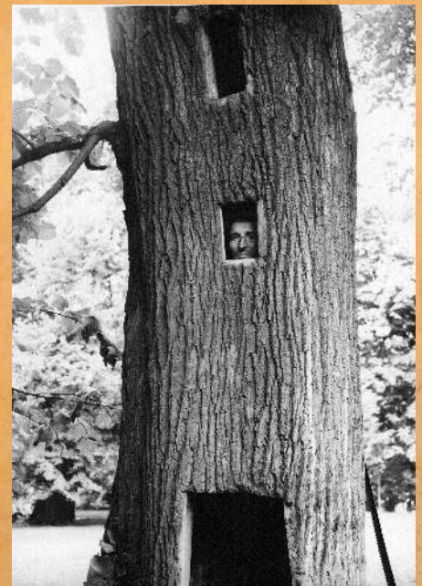
Byle do piątnastej ...