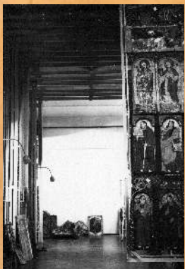
Nowy magazyn ikon. 1966 r.