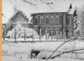
Ogrodzenie wzniesione przez PGR Ogrody w 1965 r.