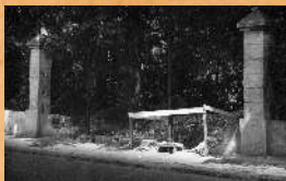
Instalacja nowej bramy od strony ul. Zamkowej. 1965 r.