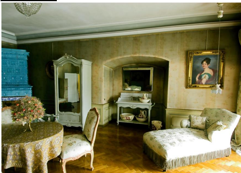
Pokój 49 II piętro