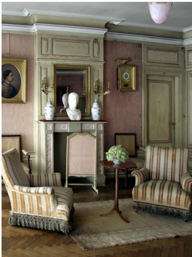
Pokój 59 II p (fragment z kominkiem)

- S 8009 a i b MŁ – Para Aplik (kinkietów) w stylu rokokowym. Tarczka w kształcie stylizowanego liści akantu, muszli, litery C o układzie pionowym. Do części środkowej tarczki przymocowano ramię świecznika w kształcie gałązki liściastej zakończonej wolutą z której dołem wychodzą trzy ramiona zakończone kieliszkiem na świecę.