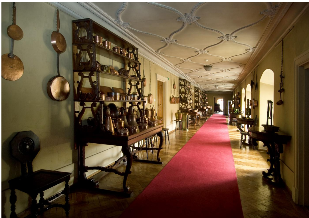
Korytarz wschodni II piętro