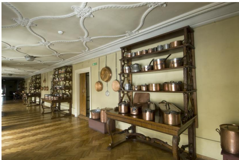
Korytarz wschodni II piętro

- trzy lampy wiszące szklane – (S 10829 MŁ, S 10828 MŁ)