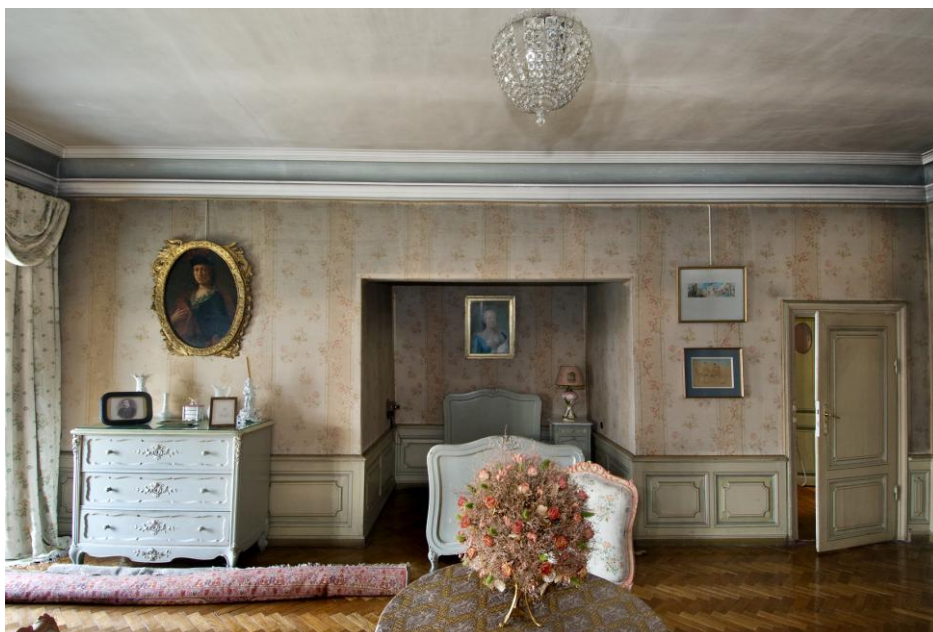
Pokój 49 II piętro

- S 10930 MŁ – Lampka wisząca z koralikami , Wiek XIX / XX, porcelana, szkło, tkanina – s Zakres prac: