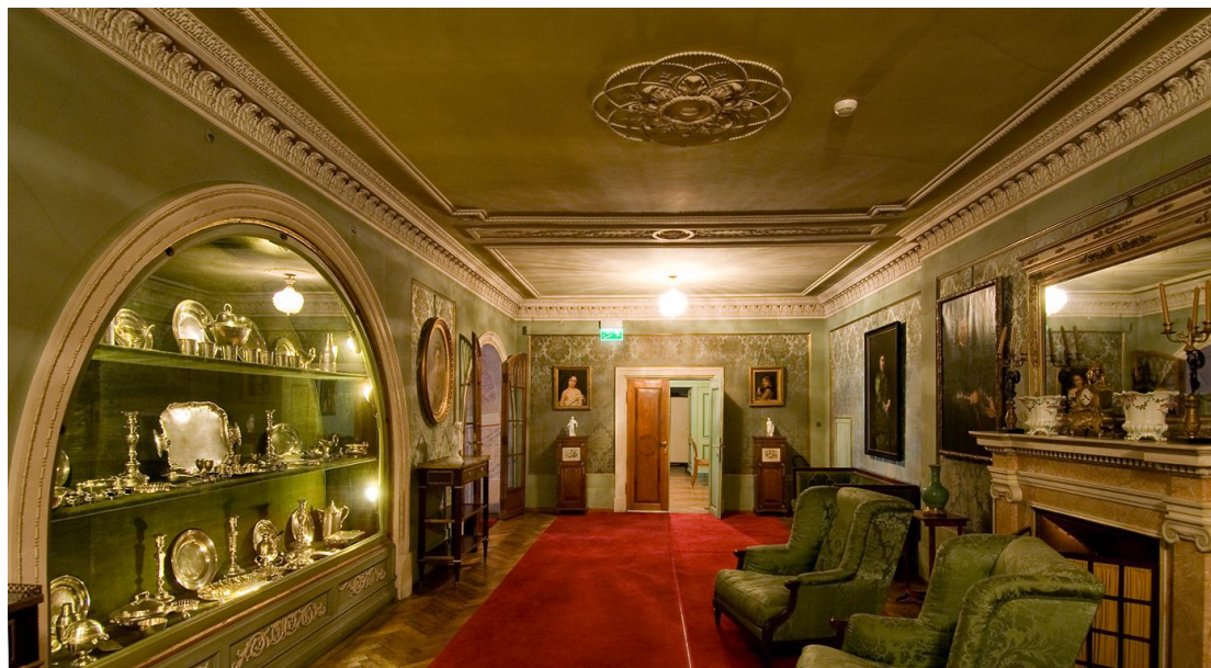
Korytarz zachodni II p.

- S 3503 MŁ – lampa wisząca kryształowa zawieszona na metalowym pręcie. Klosz półkolisty z przezroczystego żeberkowanego szkła w kształcie patery. Anglia ? XIX / XX, szkło kryształowe, lane, mosiądz